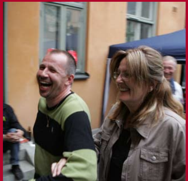
Man kan også more sig til NBS