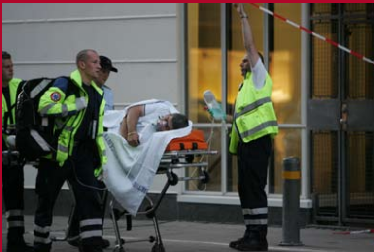
Endnu et skud drama i København