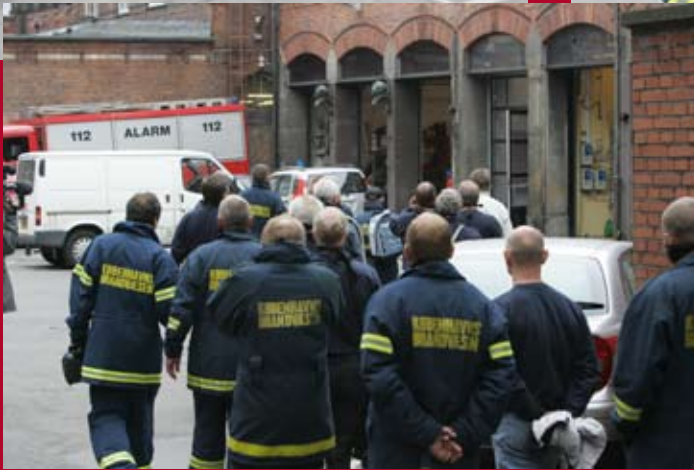
Københavnske brandmænd i tavs protest mod en diktatorisk ledelse